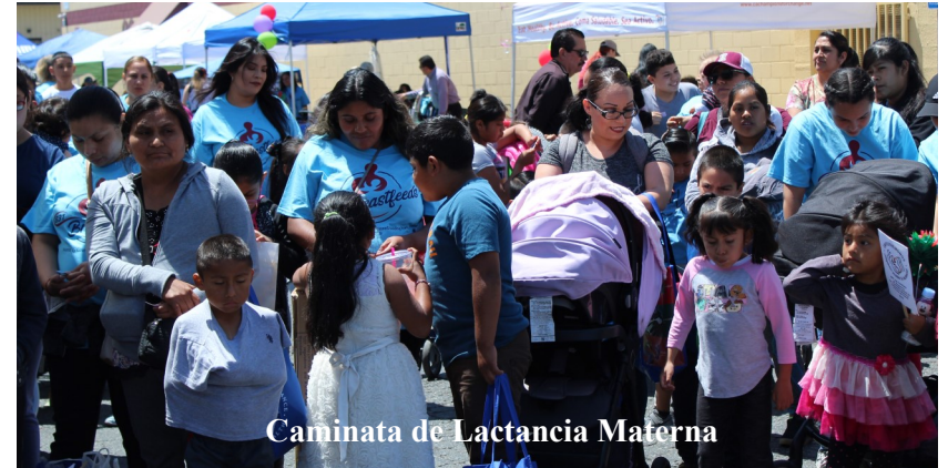
Caminata de Lactancia Materna

Lo que debe saber antes de tener a su bebé